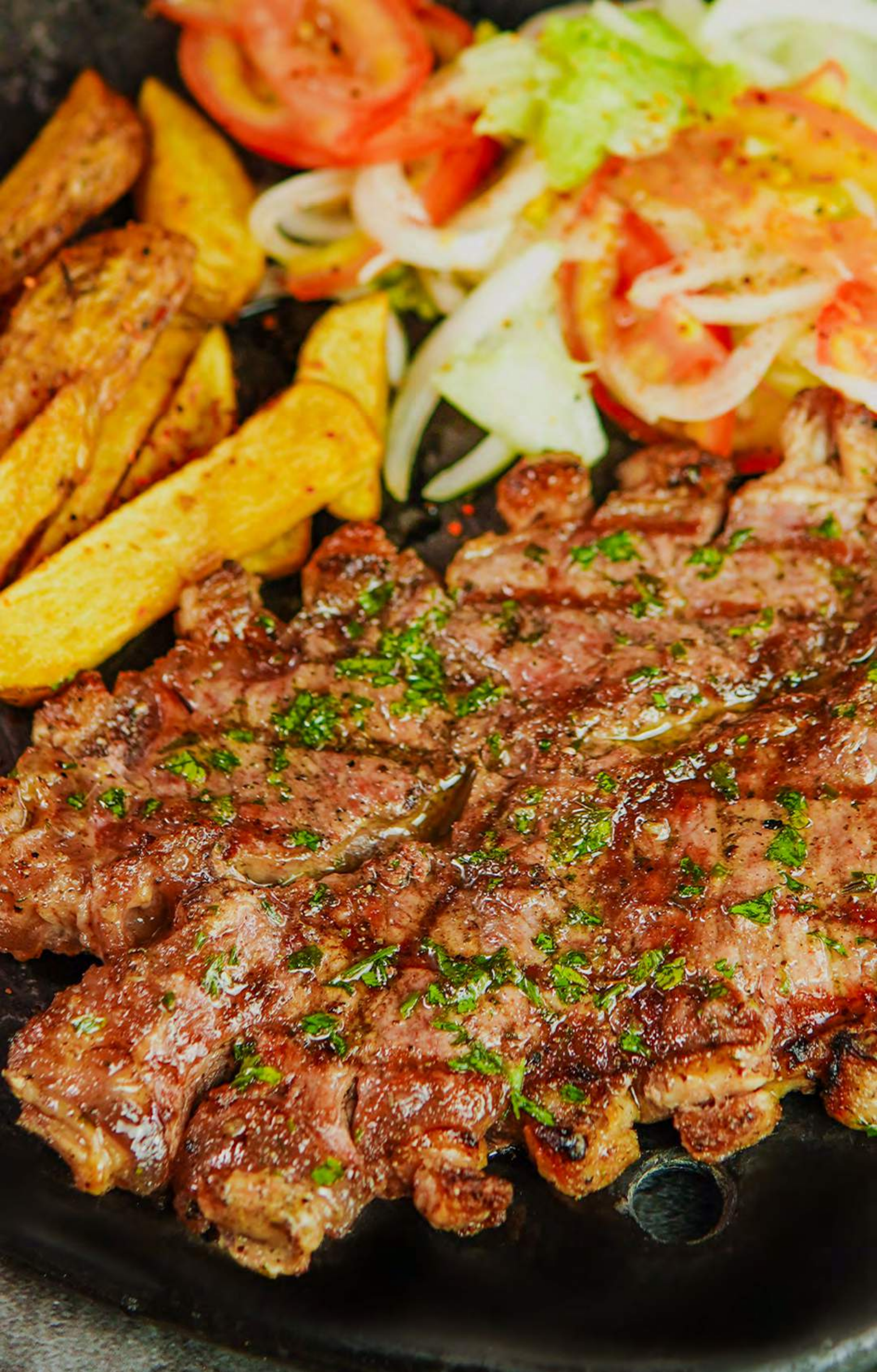
CHATA MADURADA $64.990