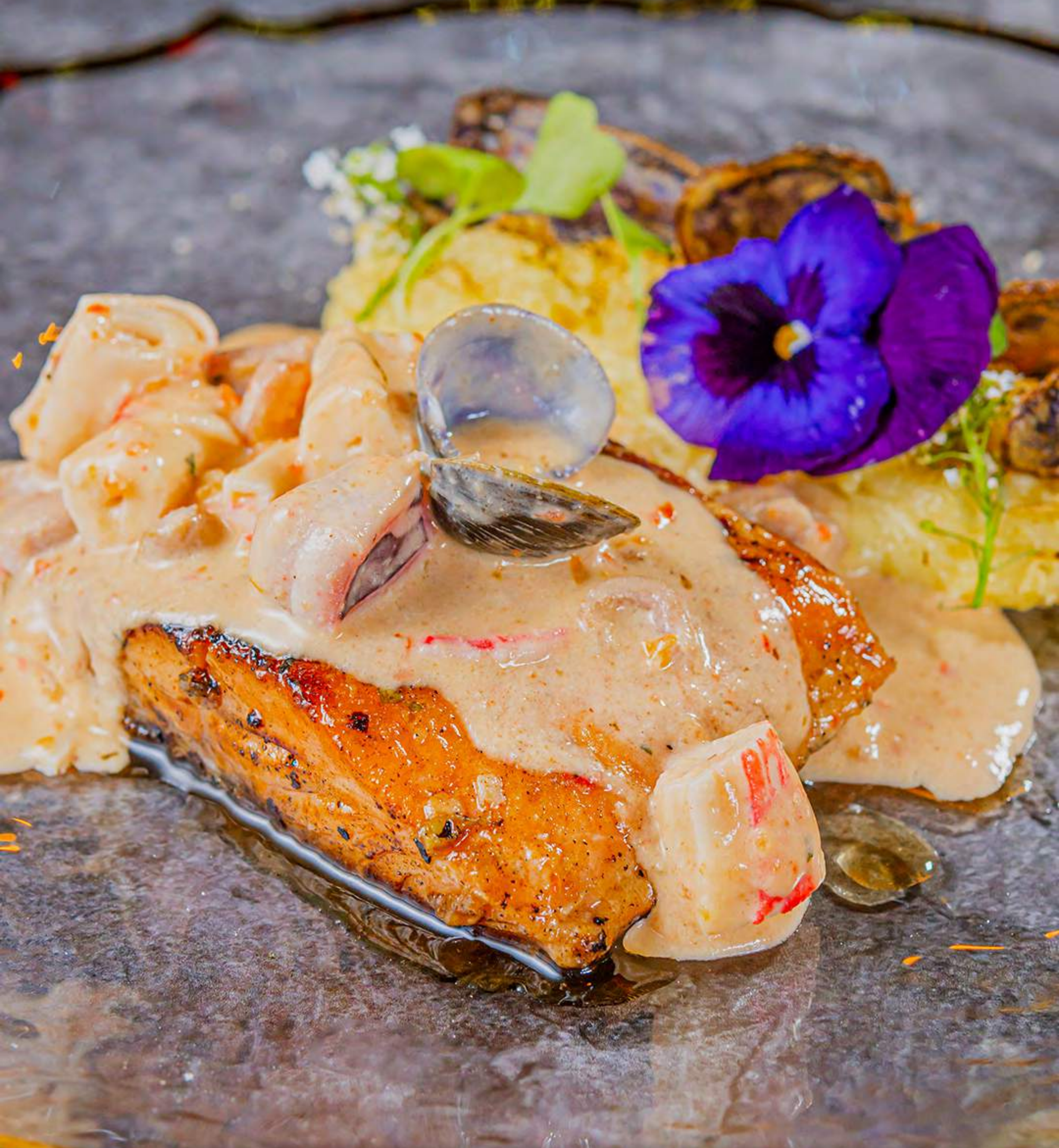
SALMÓN EN SALSA MARINERA $69.990